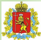
DEPARTMENT FOR TOURISM OF THE VLADIMIR REGION